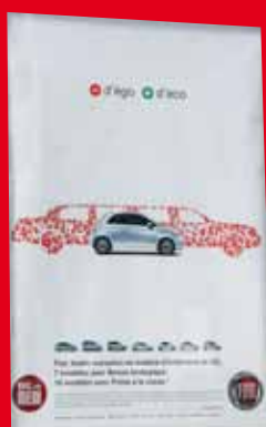
Langue française - Exemples de créativité linguistique