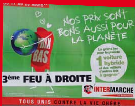
Environnement - Exemples de manquements